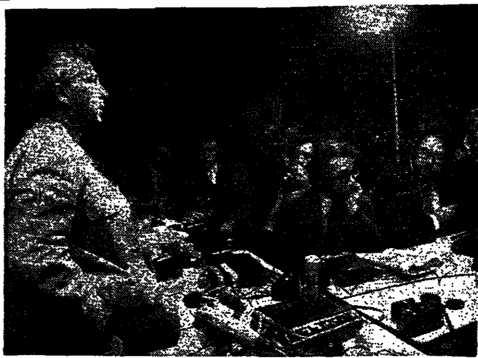
האלוף אריאל שרון, נשיא המטה הכללי, נשאל על התמורה שהושגה בקרבות ובתוצאותיה. שרון: "התמורה שהושגה בקרבות היא תוצאה של אסטרטגיה נכונה, ולא תמורה של ממש".

"תרוגות אסטרטגיים שהושגו בקרבות - הוצא מידי ישראל בלי שום תמורה של ממש" * תוקף בחריפות את דיון ואת, תפישת קו בר-לב"